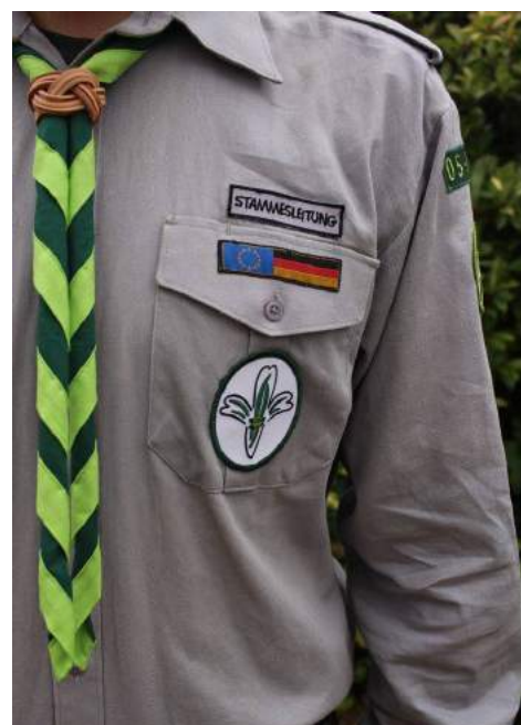
Brusttasche mit PEC-Logo

Über der Brusttasche werden Stamm- und Leitungsränge getragen. Der entsprechende Schriftzug wird mittig über der linken Brusttasche getragen.