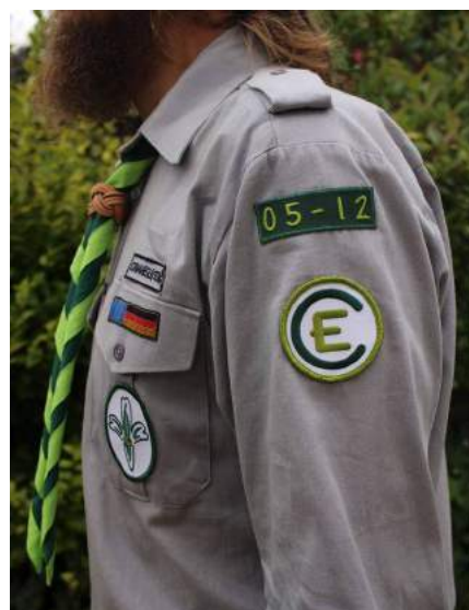
Stammnummer und EC Logo

3cm unterhalb der Stammnummer wird das EC-Logo getragen.