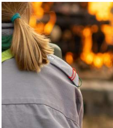
Feuer- und Messerprüfung