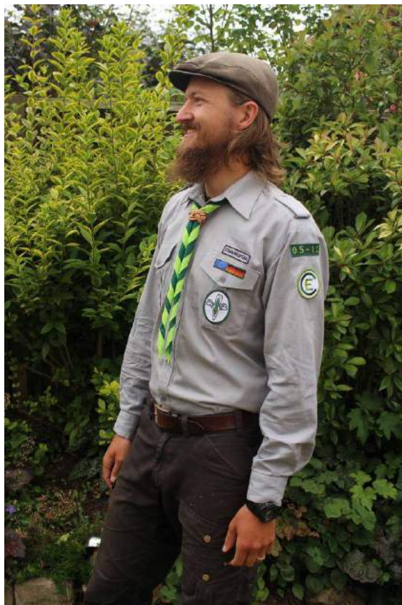
Klufft der PEC

Eine ordentliche und einheitliche Tragweise der Klufft innerhalb der Sippe zeigt, dass man auf sich und seine Sippe etwas hält.