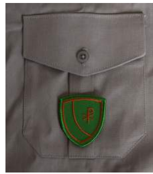
Kompetenzabzeichen Jungpfadfinder - Bronze

Ab Jungpfadfinderstufe gibt es je drei Kompetenzabzeichen: Bronze, Silber und Gold. Die Abzeichen werden nach Ablegung der Prüfungen im Logbuch vom Sippenleiter übergeben.